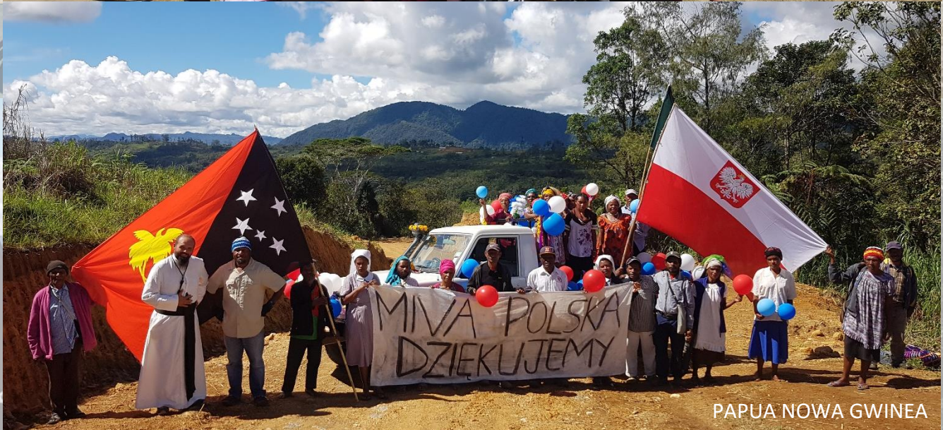
PAPUA NOWA GWINEA