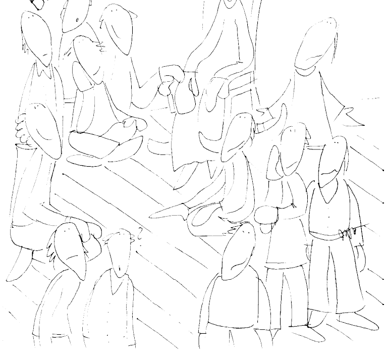
Tu zegnij najpierw - do rodka

ON USIADŁ, PRZYJAZDZIŁ DO NICH: JEŚLI KTO CHCE BYĆ PIERWSZYM, NIECH BĘDZIE OSTATNIM I WSZYSTKICH I SŁUGĄ WSZYSTKICH.