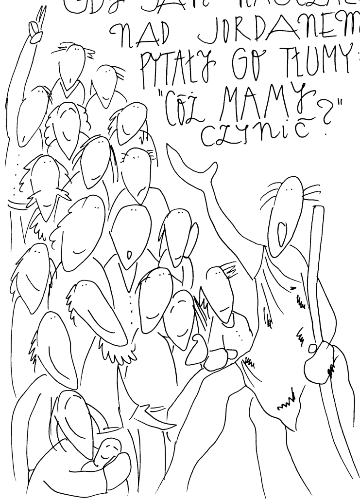
Ewangelia na niedzielę 12.12.2021r. ŁK 3,10-18

GDY JAN NAUCZAŁ 2 NAD JORDANEM, PYTAŁY GO TŁUMY: "CÓZ MAMY CZYNIĆ?"