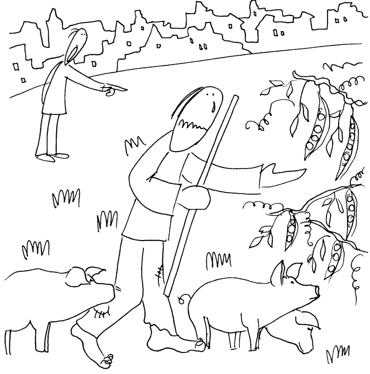
Tu zegnij najpierw - do rodka

A GDY WSZYSTKO WYDAŁ (...) PRZYSTAŁ NA SŁUŻBĘ DO JEDNEGO Z OBYWATELI OWEJ KRAINY, A TEN POSŁAŁ GO, ŻEBY PASEK ŚWINIE.