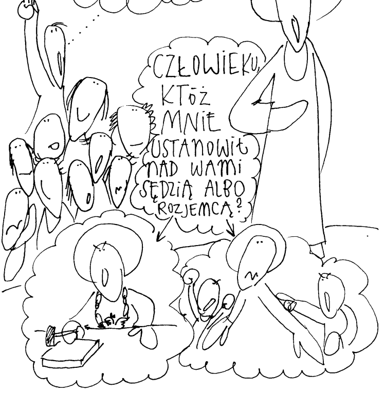
Ewangelia na niedzielę 31.07.2022r. Lk 12,13-21

"NAUCZYCIELU, POWIEDZ MOJEMU BRATU, ŻEBY SIĘ PODZIELIŁ ZE MNĄ SPADKIEM..."