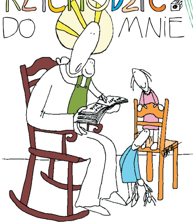
Ewangelia na niedzielę 07.08.2022r. Łk 12,32-48