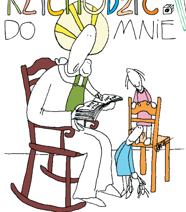
Ewangelia na niedzielę 14.08.2022r. Łk 12,49-53