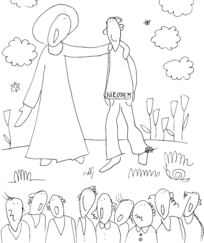
Ewangelia na niedzielę 04.06.2023r. J 3, 16-18