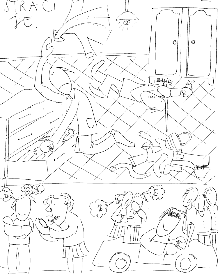
Tu zegnij najpierw - do rodka

5 a kto straci swe życie z mego powodu, znajdzie je.