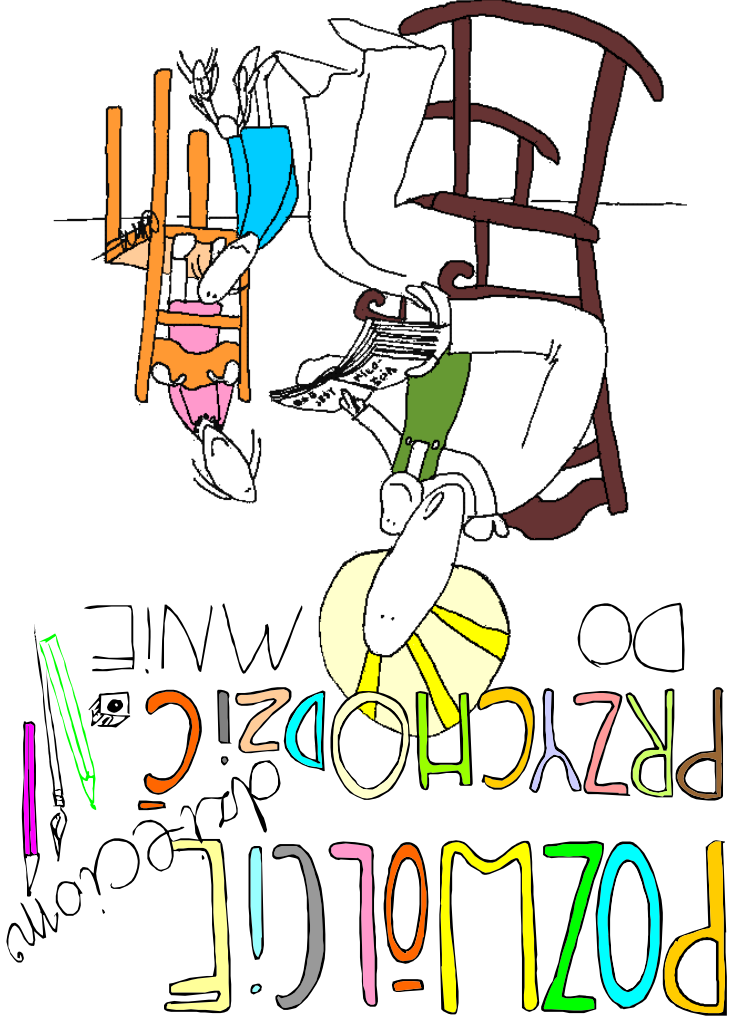
Ewangelia na niedzielę 02.07.2023r. Mt 10,37-42