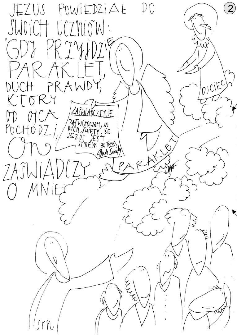
Ewangelia na niedzielę 19.05.2024r. J 15, 26-27; 16, 12-16