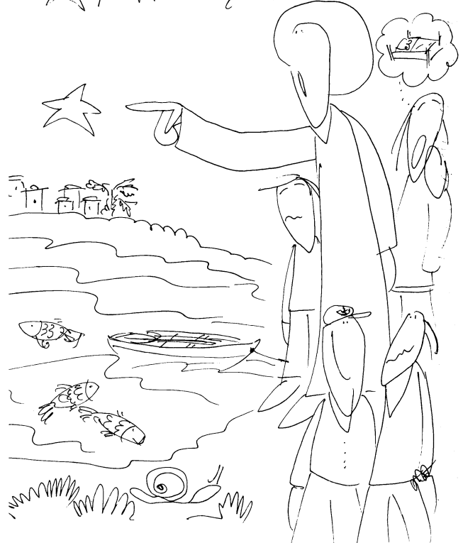
Ewangelia na niedzielę 23.06.2024r. MK 4, 35-41

OWEGO DNIA GDY ZAPADŁ WIECZÓR JEZUS RZĘKĘ DO SWOICH UCZNIÓW: "PRZEPRAW ☆ MY SIĘ NA DRUGĄ STRONĘ